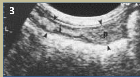
FOTO 3: Via echografie kan vastgesteld worden dat de placentaplaatsen (p) in de baarmoeder niet genoeg hersteld zijn.

Langdurig vaginaal bloedverlies na de partus wordt geassocieerd met 'subinvolutie van de placenta plaatsen' of SIPS. Bij deze aandoening zien we een vertraagde heling van de placentaplaatsen (foto 1), door trofoblast-cellen (zie foto 2) die de heling van de bloedvaten in de baarmoeder hinderen. Meestal vertonen de teefjes geen andere symptomen, uitgezonderd bij sterk bloedverlies kan dit leiden tot bloedarmoede. Wanneer bij de teef SIPS gediagnosticeerd wordt (onder meer via echo, zie foto 3), kan zij hiervoor behandeld worden zonder blijvende gevolgen voor de vruchtbaarheid.